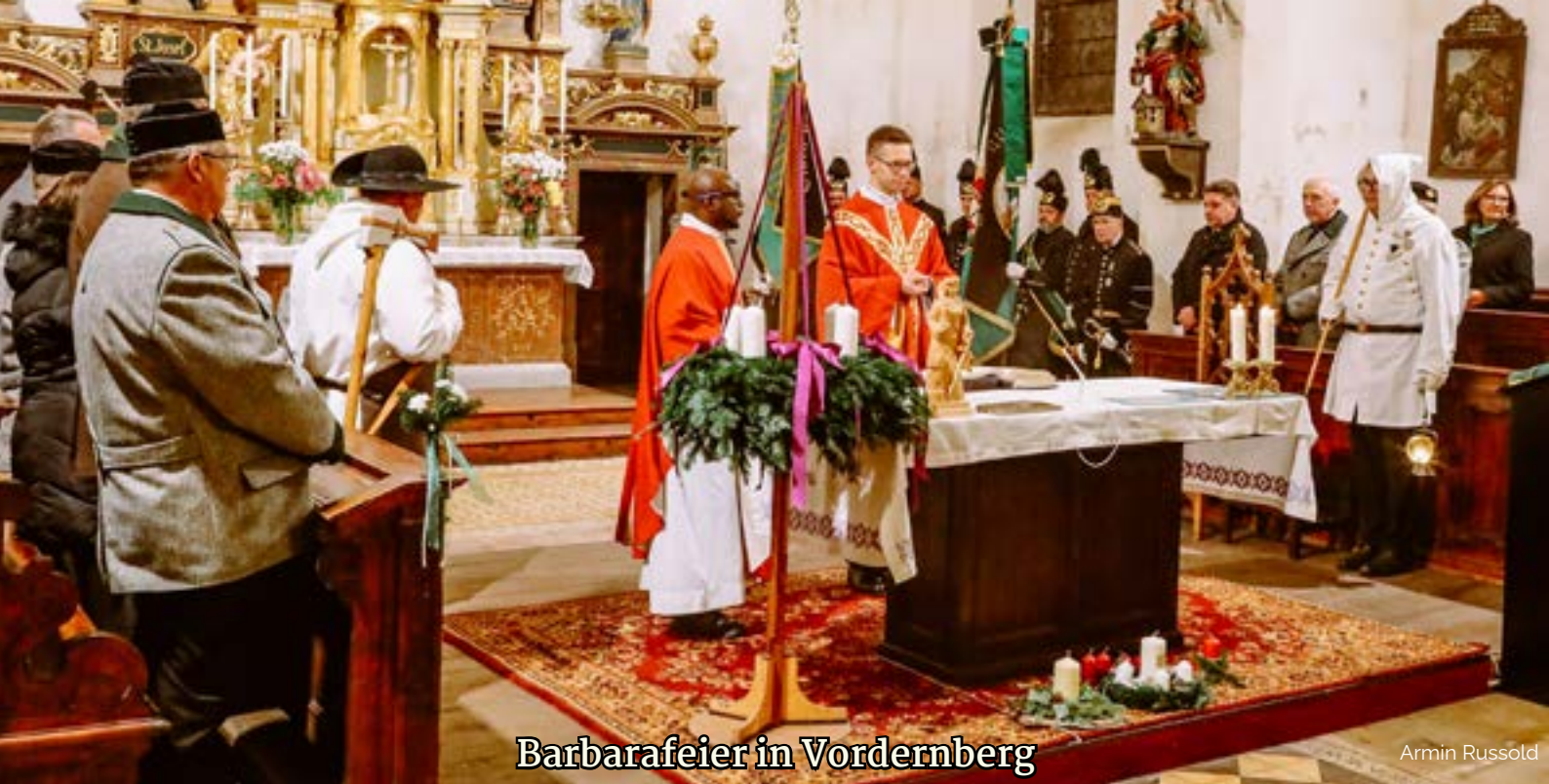
Barbarafeier in Vordernberg