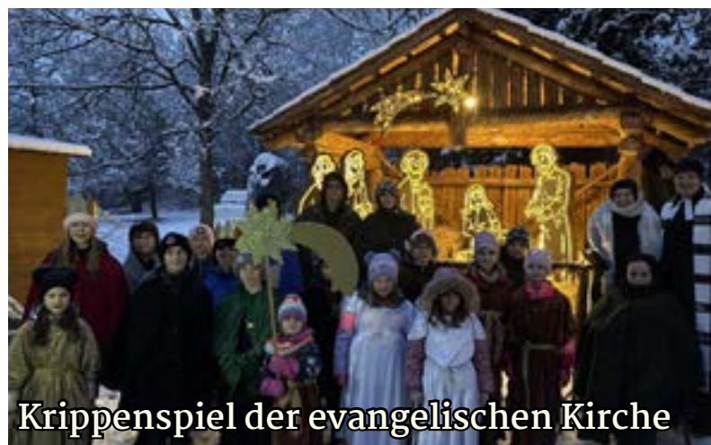
Krippenspiel der evangelischen Kirche