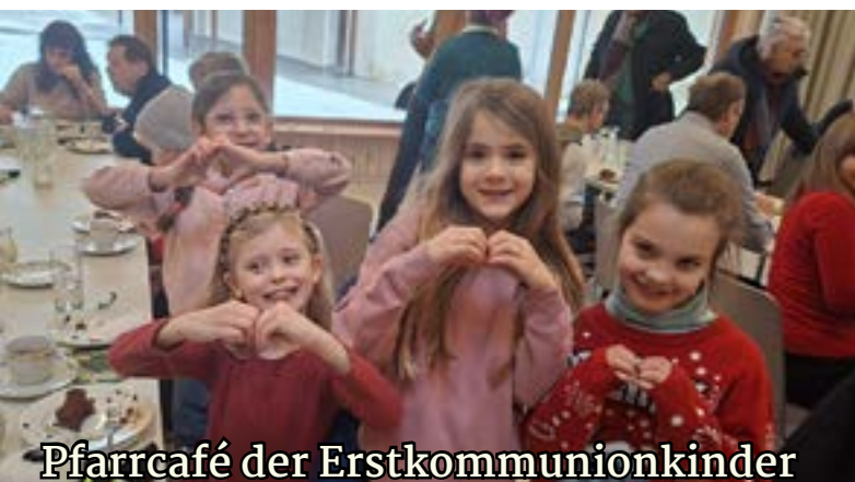
Pfarrcafé der Erstkommunionkinder