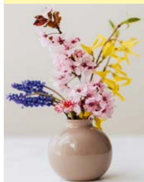
Gott segne dich und gebe dir Kraft auf deinem Weg der Heilung.

Als Zeichen der Verbundenheit wollen wir - soweit möglich - allen Katholik:innen, die im LKH Leoben sind, eine Karte mit Segenswünschen übermitteln. Damit möchten wir unsere Verbundenheit mit unseren Kranken ausdrücken und sie besonders in unser Gebet einschließen. Das Billett lädt ein, Kontakt mit der jeweiligen Pfarre aufzunehmen. Gerne können Sie sich melden, wenn sie - besonders nach der Rückkehr nach Hause - einen Besuch durch einen Seelsorger wünschen oder die heilige Kommunion zu Hause empfangen möchten.