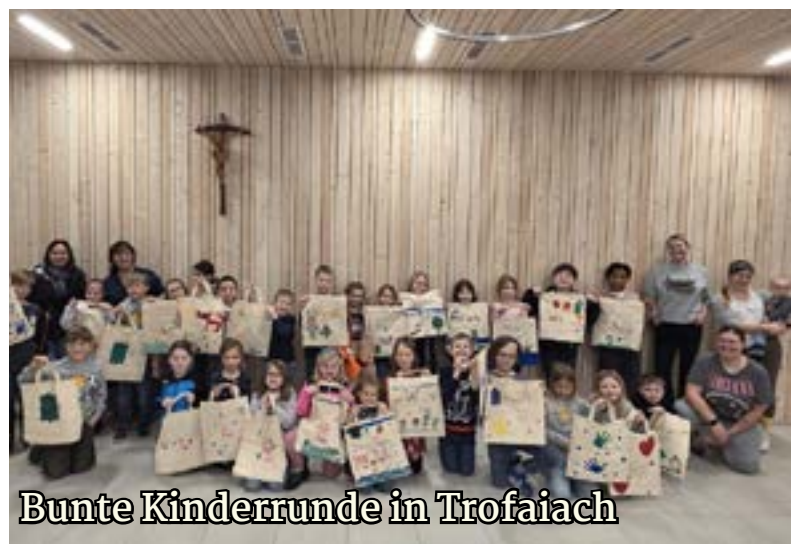
Bunte Kinderrunde in Trofaiach