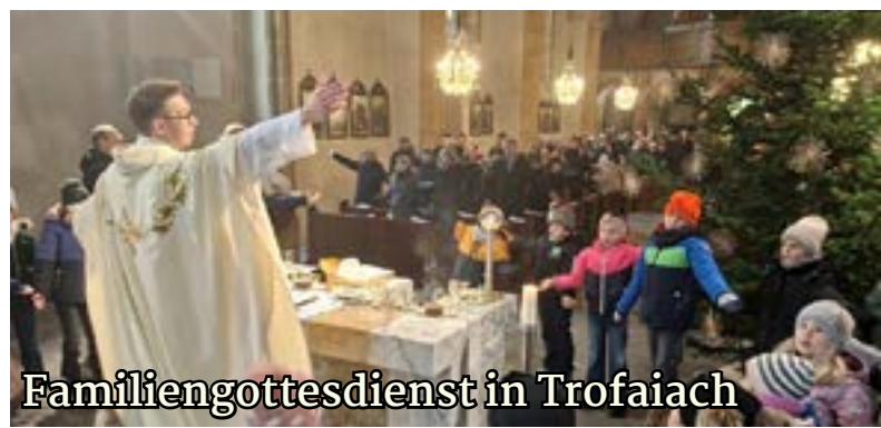
Familiengottesdienst in Trofaiach