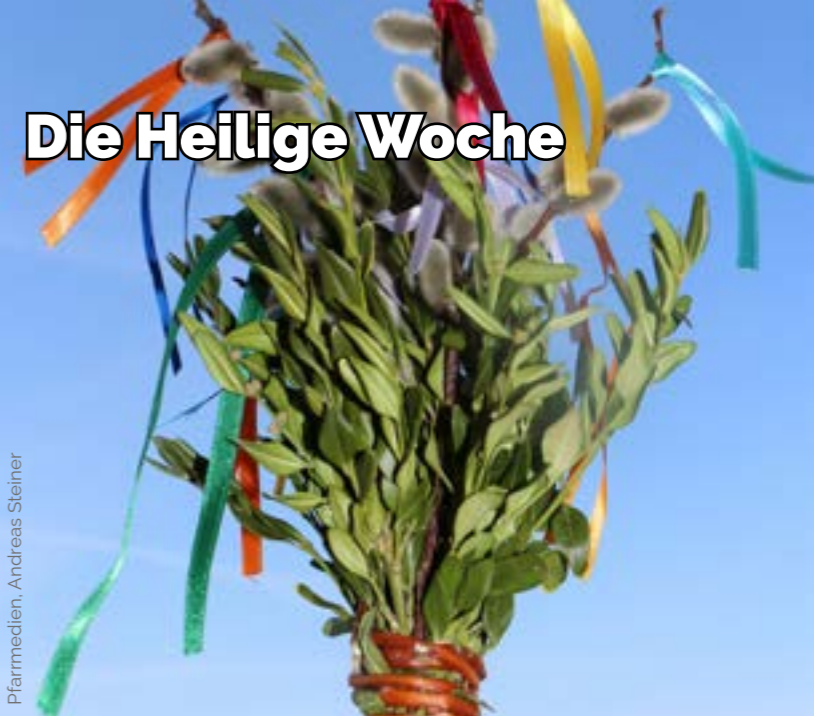
Pfarrmedien, Andreas Steiner