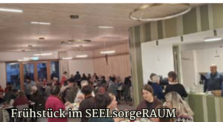
Frühstück im SEELsorgeRAUM